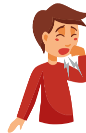
Tos y dificultad respiratoria