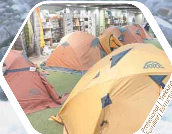
Amplia gama de Carpas

Profesional | Trekking Familiar | Estructurales