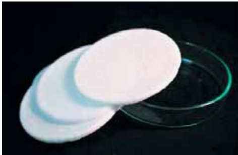
Láminas del medio donde se hacen los cultivos

externamente, donde es necesario que se forme nuevo cartílago. Esta forma de obtener el material reduce los tiempos de recuperación, y con ello los costos asociados en el aspecto médico y laboral. Además de los accidentados, hay deportistas que sufren desgaste prematuro de cartílagos en su rodilla, y también casos asociados al sedentarismo y el sobrepeso”, explica.