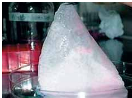
Trozo de cultivo de piel hecho en laboratorio con células autólogas, es decir, multiplicadas artificialmente.

Por sus características, el proyecto de cultivos de piel fue reconocido por CONICYT como uno de los mejores del 2010, pues lleva la ciencia a la vida real de las personas, al tratarse de una investigación aplicada. Sin embargo, también se ha traducido en aportes en ciencia básica: “Esta ha sido una investigación aplicada durante la cual hemos hecho muchos descubrimientos de ciencia básica sobre biología celular, como cultivar, biología de células madres, sus factores de crecimiento y otros aspectos. Fue un poco a la inversa de lo tradicional, pues haciendo investigación aplicada hemos realizado ciencia”, señala Weinstein.